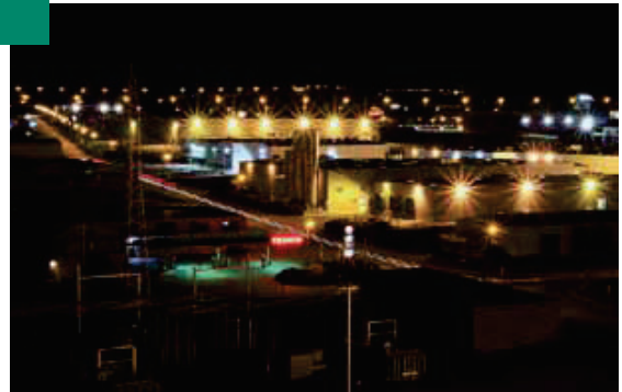
2 e Prix : Dominique DEFRANCE – Woodenergy