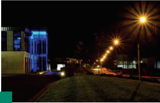
1 er Prix : Alain ENGELSKIRCHEN - Ortmans Inox